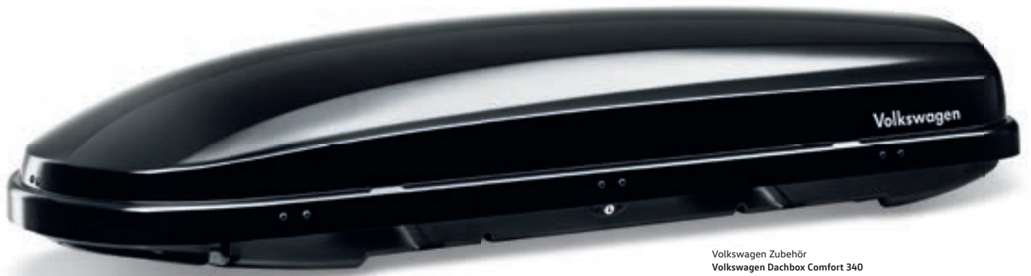
Volkswagen Zubehör Volkswagen Dachbox Comfort 340